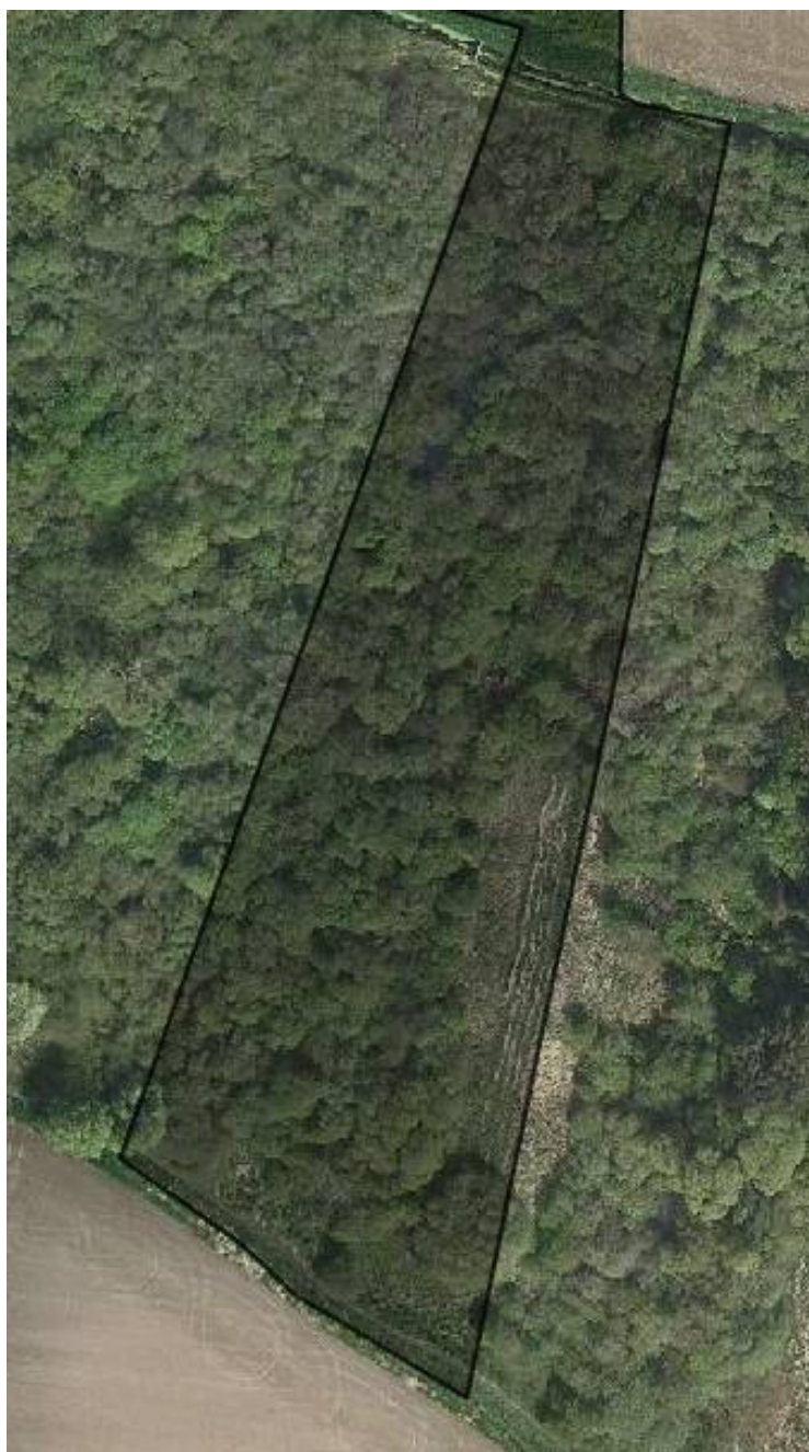
Luftfoto fra 2008 og 2009 af mosen med og uden blade på løvtræerne