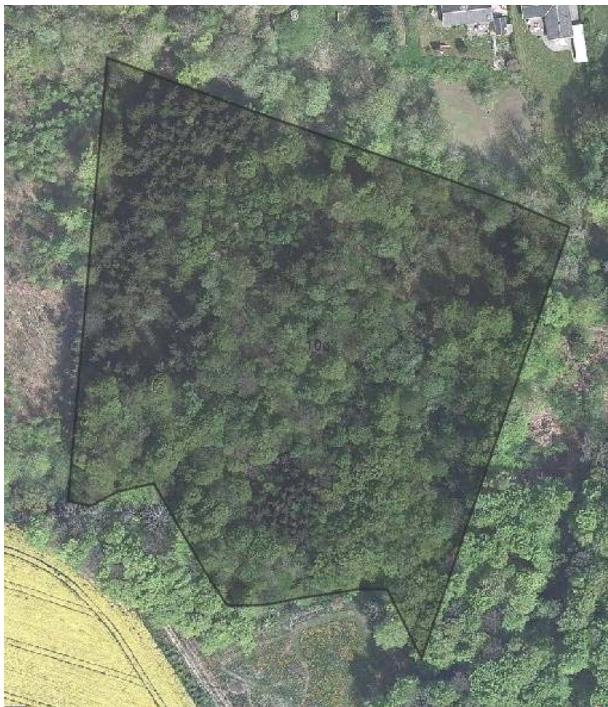
Luftfoto fra 2008 og 2009 af skoven med og uden blade på løvtræerne