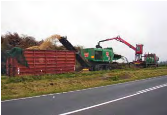
Jenzhugger i aktion. Logistik der kræver planlægning.

Danmark skal være fossilfrit i år 2050, og der skal være markante milepæle med klare reduktionsmål i 2020. Det er meget ambitiøse planer, og der skal investeres betydelige milliardbeløb; konklusionen er klar: Klima og energi er kommet højt på den politiske dagsorden, og det er kommet for at blive. Det er en lykkelig situation for skovbruget – vi har verdens bedste produkt, der omsætter solenergi til bioenergi på en naturvenlig og bæredygtig måde. Og der er kunder i butikken!