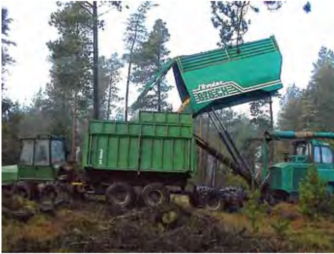
Flishugger på arbejde.

for de transporttunge operationer, har vi i dag effektive flisløsninger, også til denne type skov. Den driftstekniske udfordring i disse år er at finde rationelle maskinløsninger til de helt tidlige indgreb i de små dimensioner (8-10 cm i brysthøjde); her ligger muligheden for den rigtige pasning af f.eks. skovrejsningsarealer og stamtalsrige selvforyngelser.