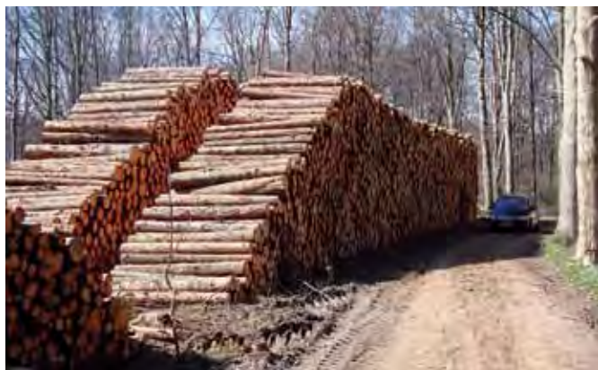
Rådgivningen og håndteringen i forbindelse med salg af råtræ er måske en af de væsentlige årsager til at være medlem af en skovdyrkerforening.

For det enkelte medlem drejer det sig bl.a. om at få solgt sine produkter fra skoven bedst muligt. Vi er løbende opmærksomme på mulighederne i såvel den traditionelle afsætning af tømmer og kævler til savværker som på mulighederne for salg af specialeffekter som piloteringspæle, flagstænger, finérkævler i løvtræ m.v.