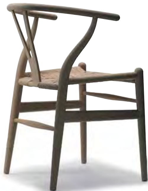
Eksempel på hvad dit træ kan bruges til. En Wegner-stol fabrikeret hos Carl Hansen & Søn. Foto venligst udlånt.

Nu er plankerne klar til at blive savet ud til emner – eller firkanter, der kan indgå som komponenter i møbler. Når savværket køber 1 m 3 bøg, bliver der kun 0,33 m 3 emner