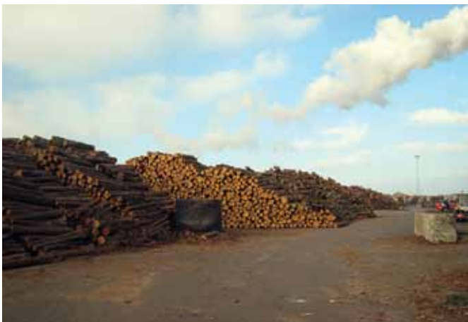
En lille del af det 2,45 m råtræ, som bruges til palleproduktion.

DTE er blevet et af de største – hvis ikke dét største – savværk herhjemme. »Vi opskærer ca. 250.000 m 3 råtræ om året. Af denne mængde er ca. 20-25.000 m 3 import – primært fra Tyskland. Resten købes i de danske skove. Dertil kommer et forbrug på 70-80.000 m 3 opskårne varer, som