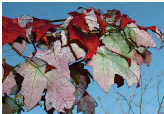
Acer rubrum - rød løn.

Abies Equi-trojani. Fra Kaukasus (som almindelig nordmannsgran) men fra Tyrkiets bjerge. Den er formentlig meget robust overfor vinterfrost. Plant den højt i terrænet, gerne på mager jord. Nåle og skudbygning ligner meget nordmannsgran, måske lidt mere etageret. Folkene på Landbohøjskolens Arboret mener, at den har et stort potentiale som juletræsart. Men vi ved det ikke, da den er meget sjældent tilgængelig.