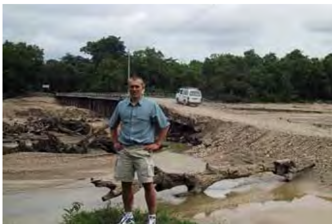
Skovene over alt i verden er et værn mod erosion. De er vores grønne lunger. Skovrydning bidrager på verdensplan med 15-20% af CO 2 -udslippet.

Dansk biomasse kan dog ikke løse hele problemet med at skabe det "CO 2 -neutrale" Danmark her og nu. Der er simpelthen ikke nok. Men det vi kan producere forsvareligt og bæredygtigt, kan og bør frem til markederne og have en permanent plads i vores energiforsyning og skovens løbende produktion. Import i en overgangsperiode synes oplagt, og det lægges der også i høj grad op til fra energiselskabernes side. Men hvis vi baserer vores energiproduktion på import i stor stil, bliver vi lige så afhængige af leverandørlandene, som mange i dag er af de lande der eksporterer olie, kul og gas. Vi skal altså have øget den danske energiproduktion.