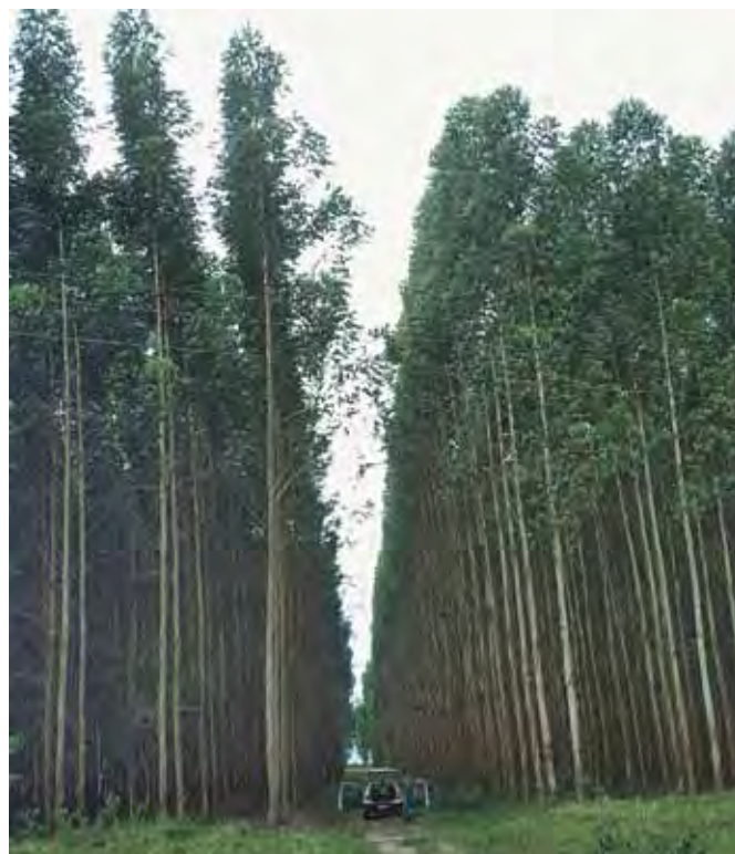
En kun tre et halvt år gammel eukalyptusbevoksning i monokultur i Brasilien. 25 m høj, diameter 18 cm og 380 m 3 pr. ha. Altså en tilvækst på godt 100 m 3 pr. år i gennemsnit. Desværre miljømæssigt set en betænkelig produktion. Foto: Leif Nutto (2000)

Den klart største tilvækst i skovareal har Kina med ca. 3 mio. ha årligt i den seneste 10-årsperiode og med 2 mio. ha årligt i perioden fra 1991 til 2000. Det er i vidt omfang højtydende plantager, der kommer til, og tilsvarende anlæg finder sted i en række andre lande. I løbet af en årrække må man derfor formode, at skovenes til-