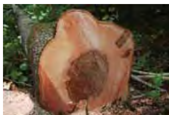
Rodende af en kævla.

Kævler efterspørges frem til årsskiftet og priserne er i niveauet 600-900 kr./m 3 i gennemsnit - det afhænger meget af træets diameter. Selv kævler med brunkerne betales godt. Mindstemålet skal holde 30 cm i diameter på midten, hvilket altså ikke er så stort et træ endda.