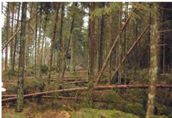
Stormfald er en hyppig årsag til store tvangshugster med deraf følgende fald i råtræ-priser.

Afdrifter kan derimod lægges på de tidspunkter, hvor man mener priserne er i top. Der er selvfølgelig faktorer, som gør, at man ikke selv er herre over tidspunktet, så-