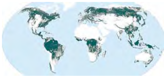
Verdens skove.

Verdens fem mest skovrige lande er Rusland, Canada, Kina, USA og Brasilien, som tilsammen rummer lidt over 50% af verdens skove – Rusland alene 20%. Disse lande er også – i nævnte rækkefølge – verdens største lande.