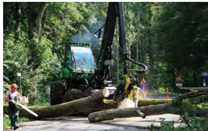
Skovning af træer over vej.

Junckertræ og brænde afsættes let, ligesom flis er gunstigt betalt. Samlet set er mulighederne for afsætning gode - så ring til din skovfoged og få din skovning på plads - det er der perspektiv i!