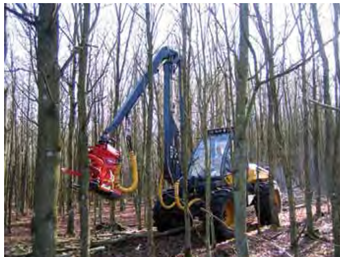
Der er stadig et stort uudnyttet flispotentialt i de danske skove. 90'ernes skovrejsninger og kulturerne efter stormfaldet i 1999 står bl.a. overfor deres første tyndinger.