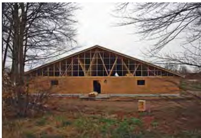
Nåletræ indgår i tagkonstruktionen, hér som høvlede gitterspær.

Et stort grantræ på 1 m 3 fældes som langtømmer og leveres til savværket, der saver bygningstømmer, planker, brædder og lægter af stokken. Savværket har et skæreurdbytte på ca. 50%. Efter tørring og høvling sælges tømmeret til en spærfabrik. Denne har bestilt tømmeret i de dimensioner, som skal bruges i konstruktionen, og derfor er der kun lidt tilskæring, inden spæret samles med sømplader. Spildet er ca. 5%