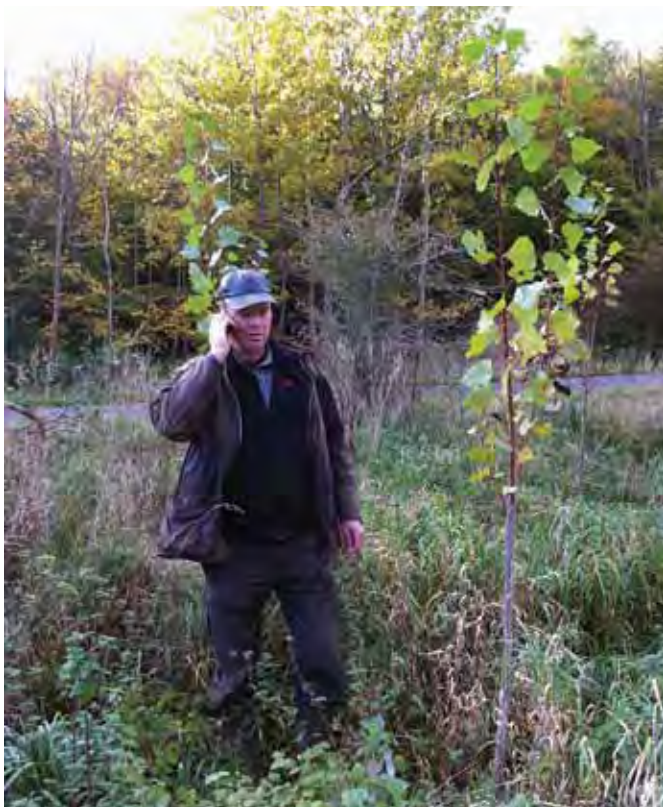
Højtydende træarter kan være med til at øge den danske produktion af biomasse til energiformål betydeligt. Poppel sat som pole efter første vækstsæson.