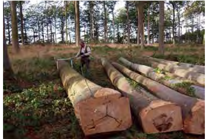
Opmåling af kævler inden træet sælges.

Betaling af træ sker i vidt omfang på 90 dage netto. Det er en meget lang kredit og normalt kræves et betydeligt fradrag for hurtigere betaling. Når syning og fakturering har fundet sted, er træet overdraget, og kunden er ansvarlig for hjemkørslen. Ansvar overgår til kunden ved hjemkørsels start, dog senest 30 dage efter faktureringen. Kunden har som udgangspunkt ret til at lade træet ligge i skoven i flere måneder, hvilket dog typisk er til irritation for skovejeren og evt. for naboer, som skal bruge en fælles læggeplads.