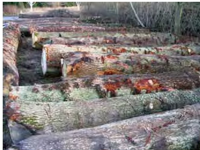
Egekævlér i stor dimension og aflagt på faldende længde.

Aflægges korttømmer-effekt fra bunden, vil man typisk vælge to effekttyper, en lang og en lidt kortere, for at udnytte træet bedst muligt. Prisen er stigende med øget længde og diameter på effekten. Korttømmer aflægges typisk med en mindstediameter i top på 12 cm. Øges denne diameter til eksempelvis 14 cm, stiger prisen på effekten med ca. 20 kr./m 3 .