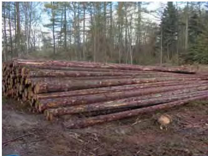
Markedet for uafkortet tømmer varierer, men der er p.t. god afsætning af stort langtømmer til Tyskland.

For nåletræet er de typiske effekter langtømmer, korttømmer og emballagetræ på varierende længder, samt cellulose-/energitræ og flistop. Er der mulighed for at aflægge stort langtømmer, vil det oftest være den mest fordelagtige løsning, idet man typisk får den øverste halvdel af tømmerstokken bedre betalt end ved aflægning i afkortet træ.