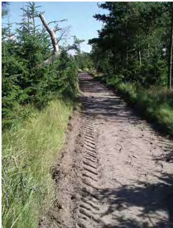
En del af plantagens sporsystem – harvet og tromlet.

pletter, hvor sollyset kan komme ned, og hvor hjortevildtet derfor elsker at opholde sig.