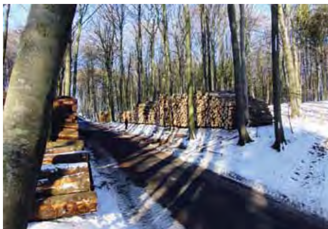
Der er skovet meget træ i sæson 10/11.

Gennem en periode har vi oplevet, at priserne på tømmertræ har været højere i dele af Sverige og dele af