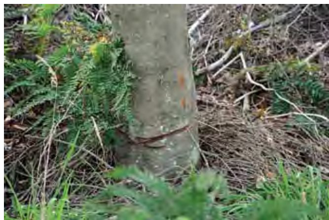
Bøg tyndet ved ringning.

Blandt bevoksningerne på Møgelkjær er også en 'naturskov' med eg og bøg. Den er plantet i 1969 i en rækkevis blanding af sitka, eg, bøg og rødæl. Sitkaerne er fjernet umiddelbart før løvtræerne blev kvalt. Herved fritstilles løvtræerne. Dem hugges der aktivt i, for at fremme dimension, og alt dødt ved får lov at ligge i skovbunden. Visse tyndingstræer ringes bare med henblik på stående træer med dødt ved. Desuden fjernes alt nål samt dominerende arter som hyld og serotina, mens selvsået tjørn og røn lades være. Ud over eg og bøg er der desuden indplantet en række andre arter, bl.a. ahorn, lind, fuglekirsebær, avnbøg, hassel, kvalkved, lind, vildæble, dunet gedebled, naur m.fl. Den største eg (fra 1969) er allerede 35 cm i brysthøjdediameter.