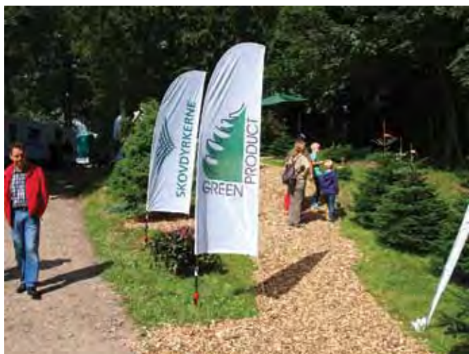
Den netop afholdte Langesømesse var godt besøgt i år.

I foreningerne og i Green Product har vi haft travlt op til messen, ikke mindst fordi mange kunder også er producenter, og derfor benytter lejligheden til at sondere markedet og besigtige kulturer både før og efter messen. Igen i år oplevede vi derfor også en godt besøgt stand med både nye og "gamle" kunder fra mange forskellige lande.