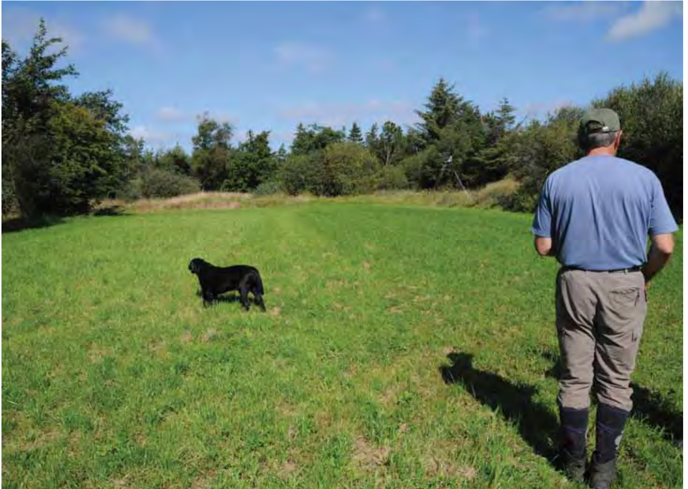
Ernæringsgrundlaget for hjortevildtet: Kløvergræsmark i omdrift.

Besøg i en usædvanlig plantage, hvor æstetik, jagt og produktion går op i en højere enhed. Hvor man arbejder med den langsigtede omstilling fra plantage til skov. Og hvor ejeren kæmper mod nogle meget store vindmøller.