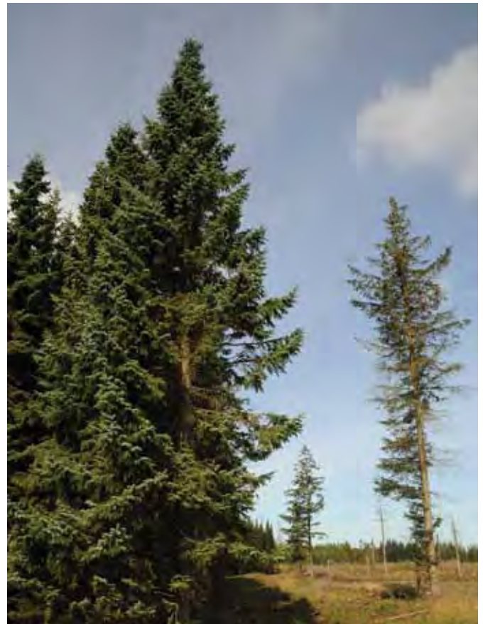
Lild plantage: Sund omorika til venstre og sammenbrudt sitka til højre.

Det er erkendt, at de to træarters tilvækst ikke er voldsomt stor. Men den synes at være stabil. Højere end løvtræets og på linie med skovfyrrens. Kvaliteten på veddet er god hos begge arter, og for cypressen er der tale om et meget varigt ved, der kan bruges til specialformål som f.eks. udendørs beklædning uden at skulle imprægneres.