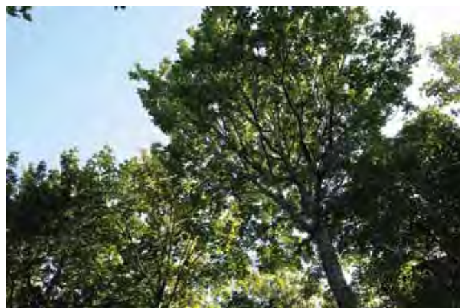
Eg 43 år. Diameter 35 cm.

I det hele taget er det Bennetsens erfaring, at »man kan skabe sin egen jordbund«, bl.a. ved det rette træartsvalg. Bennetsen er meget optaget af Junckers teorier om jordbundsudvikling og ærens rolle.