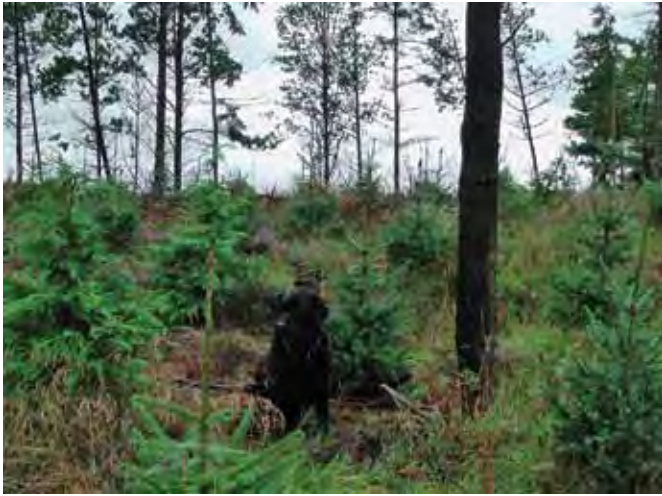
Omorika/cypres plantet 2007 på klitskråning.