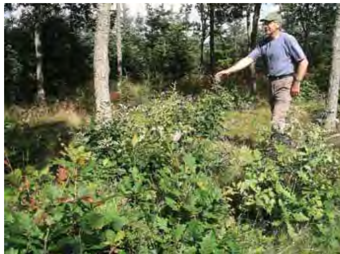
Egetydingens stødskud er fortrinligt vinterfoder.

Sporene er et kapitel for sig. De holdes helt fri for vegetation ved jævnlig fræsning og efterfølgende tromling. Derved skabes et bed, hvor dyresporene ses lige så fint, som var det i sporsne. En ideel måde at følge med i, hvor meget vildt der aktuelt færdes i skoven. Samtidig gør det nemt at færdes overalt, og de er desuden optimale til pürchjagt. Systemet forudsætter en ren sandjord.