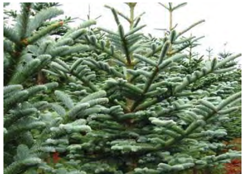
Nobilis i produktionsdygtige aldersklasser forudses at blive en mangelvare i de kommende år.