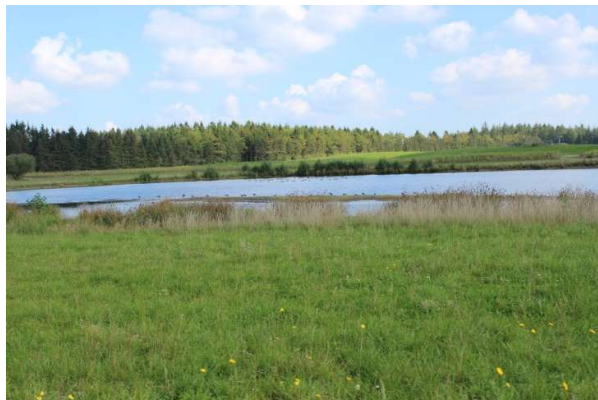
Søer over 3 ha har en beskyttelseslinie på 150 meter.

Det betyder at man skal søge kommunen om tilladelse, hvis man ønsker at foretage ændringer i søens eller vandhullets tilstand. Ligger søen i fredskov, skal Miljøstyrelsen også spørges.