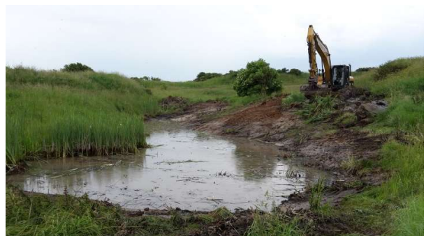
Har vegetationen overtaget kan en komplet opgravning være løsningen. Det kræver en tilladelse fra kommunen.

Gror vandhullet alligevel til, kan det reddes ved at fjerne al vegetation. Man kan også vælge en komplet opgravning af vandhullet. Det er en god - men dyrere løsning.