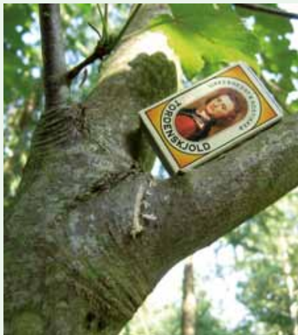
Her skæres grenen af, lige i grenkraven.