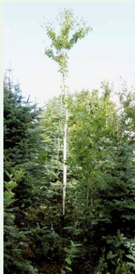
Kirsebær, hårdt og tidligt stammet op.

Du kan udpege hovedtræer, når bevoksningen er ca. 8-9 meter høj. Så er du sikker på retheden på de nederste 6-7 meter.