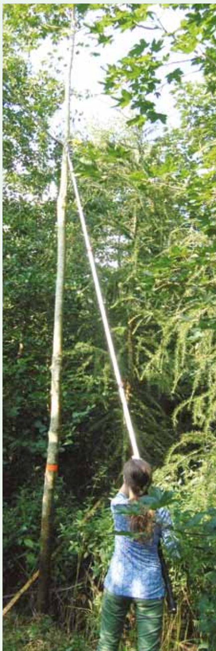
Unge piger kan også stamme op.