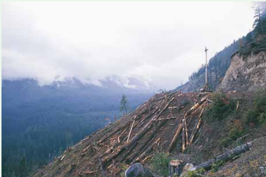
Eksploitering har været udført i de fleste lande – her skovning i staten Washington i USA 1984.

Der er et konstant underforsynet højprismarked for udsøgt træ af høj kvalitet. Danmarks små skove har logistik, uddannelse og råmateriale til at udvikle en produktion til dette marked.