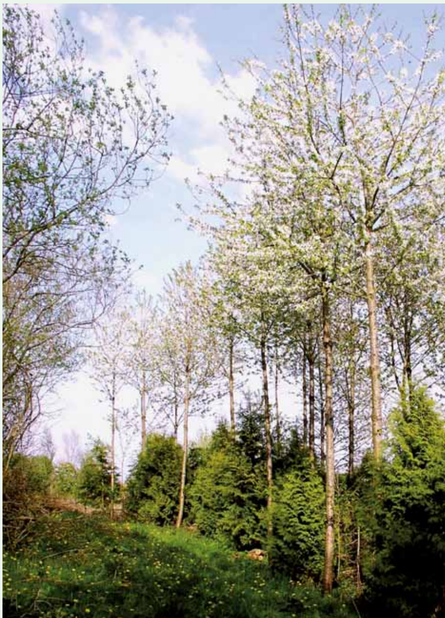
Opstammet kirsebær med thuja der skal beskytte hovedtræets stamme mod sollys.

For at sikre den unge kævle permanent mod vanris kan du plante f.eks.