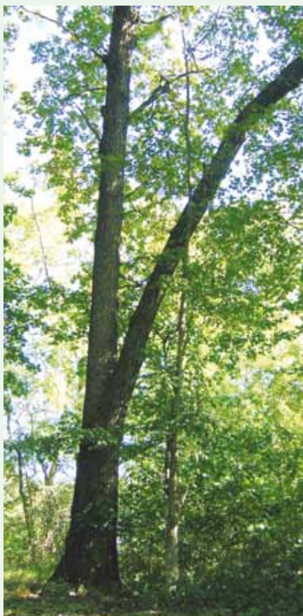
Gammel eg med spidstvege, spild af tid.

Det er kun de bedste træer der skal opstammes. Derfor skal vi først