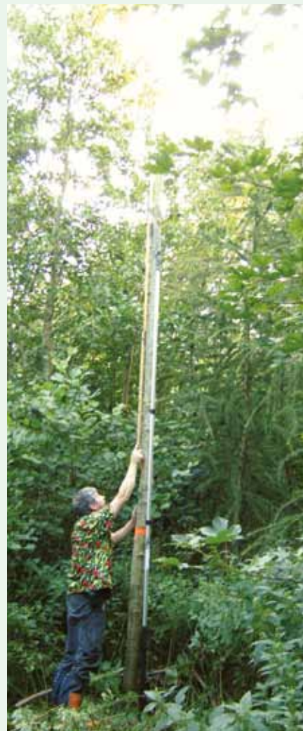
Ær 8 år fra plantning, markeret og opstammet til 5,5 m

Naturvokset knastfrit træ er ofte et produkt af høj alder, stor dimension og stor frasortering. Når der handles almindelige løvtrækævler er der en ret stor usikkerhed omkring hvad kævlen egentlig indeholder. Og usikkerhed begrænser prisen.