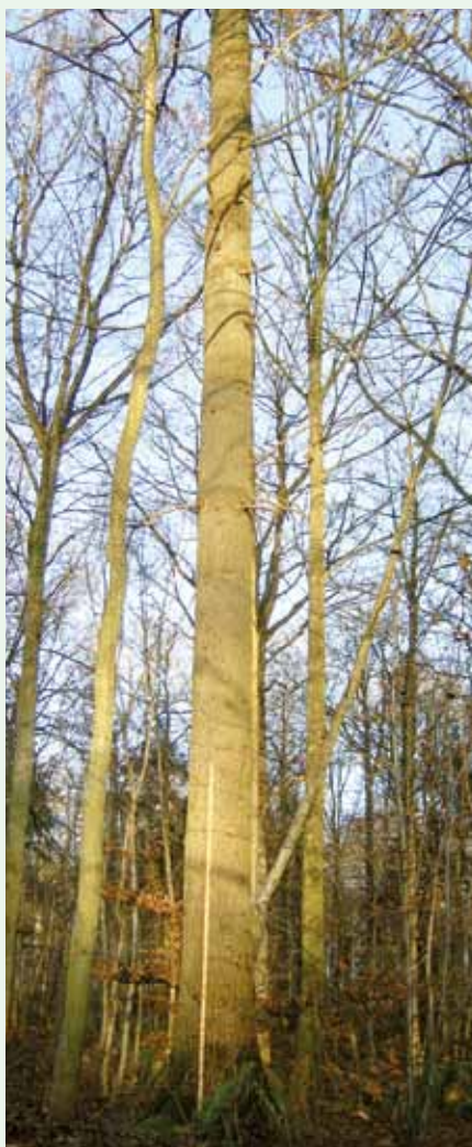
Velformet ældre eg i naturagtig bland-skov, bemærk de lave døde grene.

Vore traditionelle løvskove er højskove, hvor træerne ofte har 12-16 meter grenfri stamme. Det