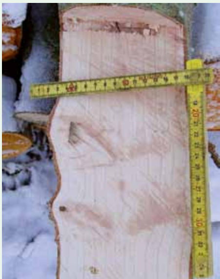
Ask 10 år fra plantning, knastfrit træ udefter. Bemærk den gode overvoksning af opstammingsåret.