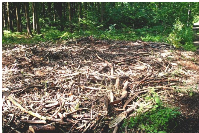
Når flisprojektet er afviklet vil der altid ligge grene, nåle og flisrester tilbage.