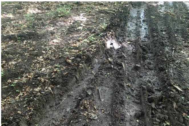
De store maskiner sætter spor i skovbunden og på skovveje, nærmest uanset vejrforholdene.

Der anvendes stort maskineri til flisprojekter og man må forvente, at maskinerne vil lave hjulspor i bevoksningerne og på stikspor og skovveje. Efter hugning af flis ligger der altid grenrester, nåle og flis tilbage i skoven og på huggepladsen. Vær forberedt på at veje og spor måske skal renoveres efter flisprojektets afslutning og at dette ikke indgår som en del af dette.